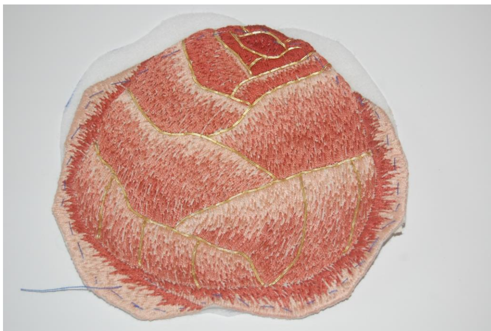
Rosen inden montage på messehagelen

Søndag den 29. marts var der festlig gudstjeneste i Hunderup Kirke. Det var første gudstjeneste, efter at kirken havde fået renoveret varmesystemet, og ved samme lejlighed indviede Arendse den nye messehagel, der er blevet syet til Hunderup og Vilslev kirker. Straks vi kom ind af døren, blev vi modtaget af messehagelen, der var hængt til beskuelse på en gine ved siden af orgelet. Den er meget smuk i gyldne farver med en rose broderet på ryggen i krydset af et gyldent kors. Langs kanten er en bort, hvor der med sirlig håndskrift er broderet nogle vers fra ”En rose så jeg skyde”.